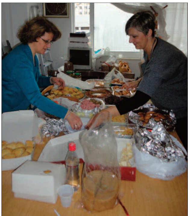
Οι γυναίκες μας για άλλη μια φορά μας έβγαλαν ασπροπρόσωπους.