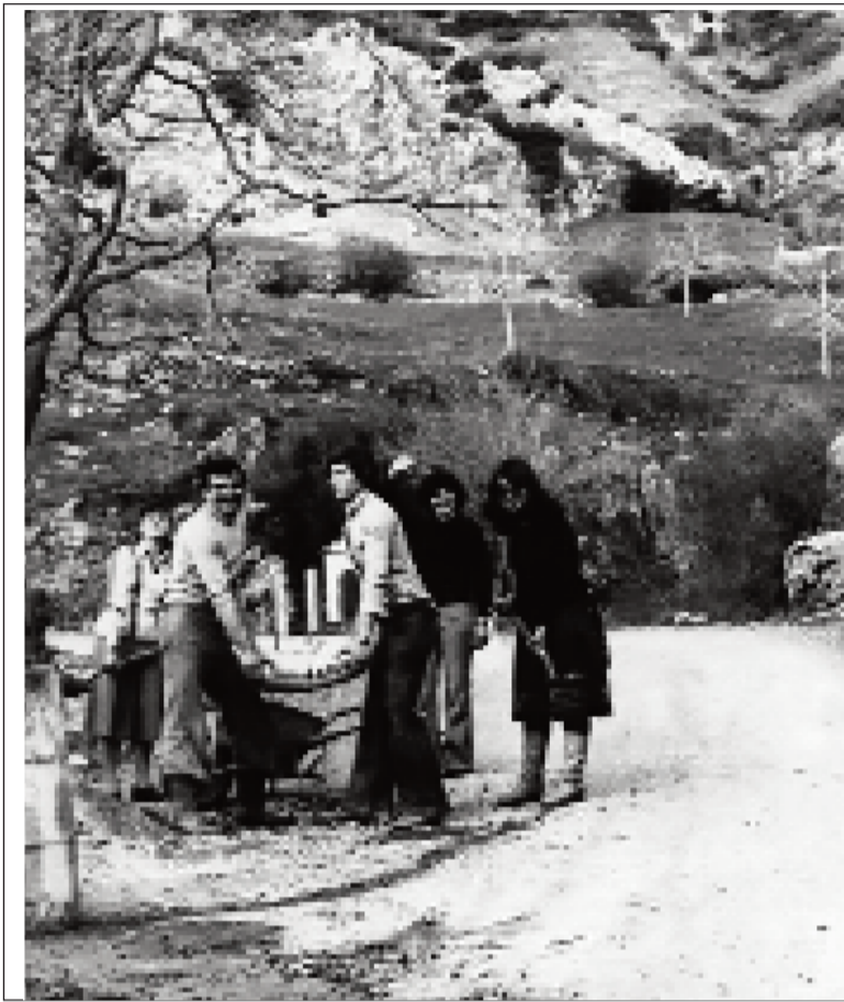
Φωτογραφία από παλιότερο εθελοντικό κάλεσμα του Συλλόγου μας. Οι νέοι του χωριού μας ξέρουν να τιμούν τις αξίες του εθελοντισμού.

Την έλλειψη γνώσης χρήσης Η/Υ και πληροφόρησης, δηλαδή την απουσία χρήσης ενός εργαλείου απαραίτητου για την ανάπτυξη, εκμεταλλεύτηκαν, για άλλη μια φορά, κάποιοι πολιτικοί. Όσο πα-